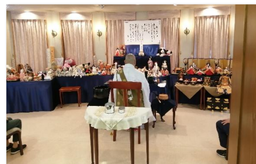
日蓮宗 天龍寺 吉水住職から ご供養のお経をいただきました

10月26日（日）セレモニーホールシオンにて人形供養祭を開催いたしました。私どもで初めて人形供養祭を開催したのは2000年。弊社でお手伝いさせて頂きましたお客様や地域の皆様のお陰で、今年26回目を迎えることができました。 お人形やぬいぐるみ等お預かりする時、そのお人形との思い出をお話しくださる方がいらつしやいます。ずっと大切にしていたからゴミとしては捨てられなくて……というお話を聞くと、温かいお気持ち伝わります。